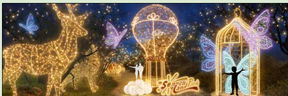
ein Vorgeschmack auf den „Winterzauber im Sonnenlandpark“

Auf über 1,5 km Rundweg um den See geht man auf eine traumhafte Reise durch die abwechslungsreiche winterliche Parklandschaft.