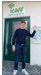
Urheber: Uwe Straßberger

Ich freue mich schon sehr auf alle neuen Aufgaben und Herausforderungen, die vor mir liegen, bin aber auch traurig, dass eine wundervolle Zeit zu Ende geht. Ich werde mich immer wieder gerne an meine Jahre im icaff zurückerinnern und wünsche dem Projekt für die Zukunft alles erdenklich Gute.