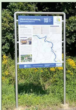
Foto: Alles im Blick mit den neuen Infotafeln

Dem einen oder anderen ist es vielleicht schon aufgefallen: Der Chemnitztalradweg ist mit einer neuen Beschilderung ausgestattet.