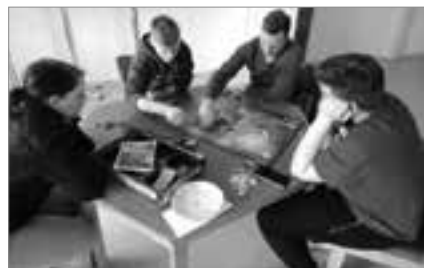
Eines der Spiele bei unserem „Pasch in den Osterferien“

Also, her mit Euren Ideen um die Sommerferien wieder einmalig und unvergesslich zu machen.