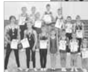
Text und Foto von H. Gypstuhl