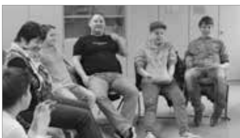
Suchtpräventionstreffen in der EVOS Frankenberg, Workshop

Auerswalder Straße 8 · 09244 Lichtenau OT Oberlichtenau · Tel.: 037208 884481