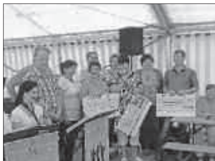
Frühschoppen mit dem Brass & Swingorchester Ottendorf