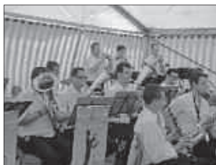
Frühschoppen mit dem Brass & Swingorchester Ottendorf

Garnsdorf mit ihren fleißigen Übungsleitern und auch die Mitglieder des „Line Dance Club“ Mittweida, die den Ottendorfern und ihren Gästen ganz spontan eine Kostprobe ihres Könnens darboten.