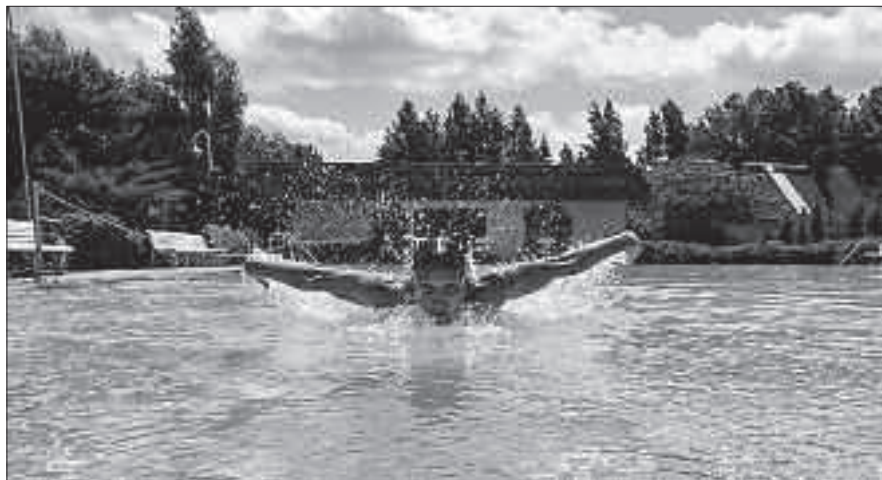
Schwimmtraining im Sommerbad Garnsdorf