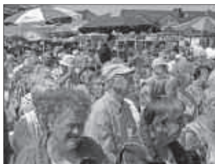
Ein gut besuchter Festplatz

Auch bei allen nicht genannten Helferinnen und Helfern möchten wir uns bedanken und wir hoffen, dass es vielleicht auch 2014 wieder ein schönes Ottendorfer Dorffest geben möge.