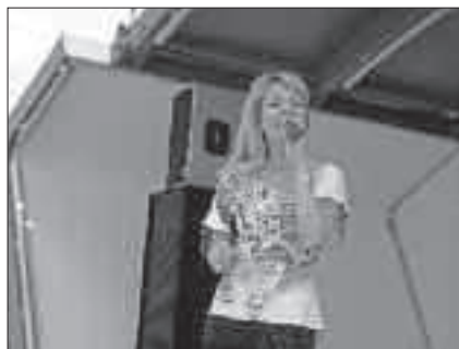
Auftritt von Uta Bresan