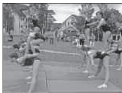
ATV Garnsdorf präsentiert sein Können

Auch der Sonntag lockte wieder ganz viele Besucher aus nah und fern auf den Festplatz. Trotz personeller Probleme begeisterte unser „Brass- und Swingorchester“ die Zuschauer im Festzelt wie immer mit einem zünftigen, stimmungsvollen Programm zum