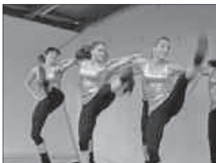
Show- und Musikeinlagen

Vom 14. – 16.06.2013 wurde in Ottendorf mal wieder gefeiert und der Förderverein der FFW Ottendorf hatte zum 20. Dorf- und Kinderfest eingeladen. Nach den Wetterkapriolen im Vorfeld und vielen bängigen Blicken zum Himmel hatte Petrus aber diesmal ein Einsehen und bescherte uns drei Tage bestes Dorrfestwetter. Dies war schon mal eine Grundvoraussetzung für viele Besucher, die dann auch vom Freitag bis Sonntag sehr zahlreich der Einladung folgten. Die flotten MKV-Mädels, die Mittweidaer „Line-Dancer“ und natürlich auch die Hart-