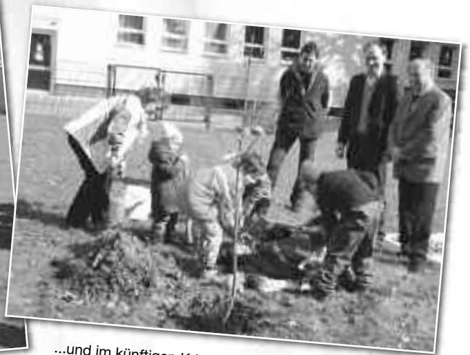
...und im künftigen Krippengelände der Kindertagesstätte „Zwergenland“ OT Oberlichtenau.