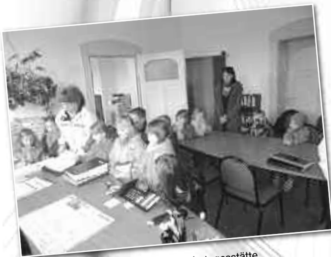
Besuch der Vorschulkinder der Kindertagesstätte „Zwergenland“ im Büro des Bürgermeisters