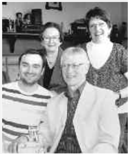
Altes und neues Praxisteam

Ich möchte mich auf diesem Wege herzlich bei den vielen Patienten, dem Bürgermeister von Lichtenau und den Vertretern der Vereine, den ärztlichen Kollegen und dem medizinischen Personal, Bekannten und Freunden für den Besuch meiner Ruhestandfeier am Freitag, dem 30.03.2012 in der Ottendorfer Amtsstube bedanken.