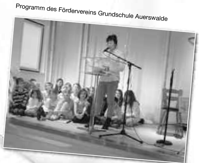
Programm des Fördervereins Grundschule Auerswalde