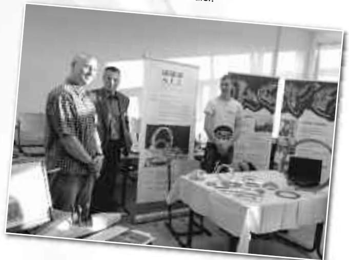
Das Berufsorientierungsforum in der Mittelschule Lichtenau am 21.03.2012 erreichte über 160 Schüler.