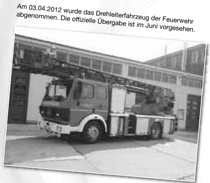
Am 03.04.2012 wurde das Drehleiterfahrzeug der Feuerwehr abgenommen. Die offizielle Übergabe ist im Juni vorgesehen.