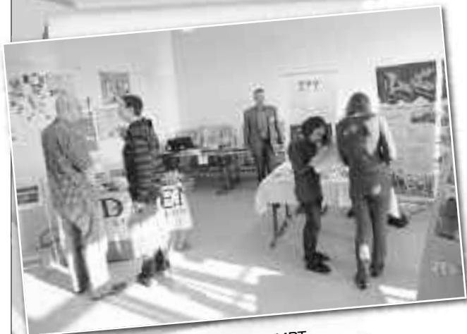
Jeld -Wen und MPT