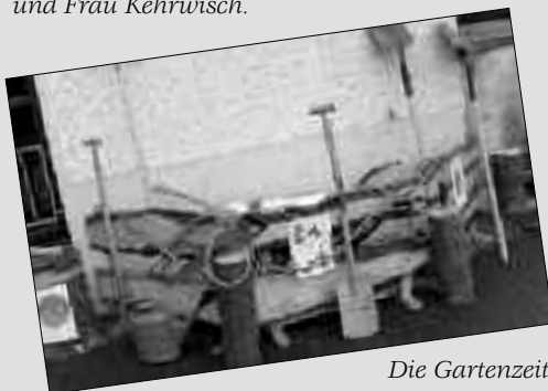
Die Gartenzeit kann kommen.