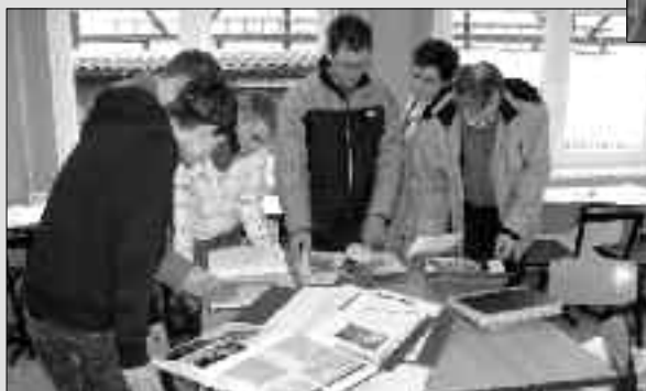
Noch un- schlüssig?