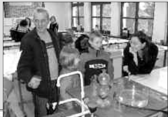
Schulchronik dicht umlagert.