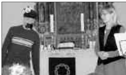
Agent Cleverus in Aktion

Vom 12. bis 15.2.08 fand in der Niederlichtenauer Kirchgemeinde wieder eine Kinderbibelwoche statt. 38 Kinder hatten sich angemeldet und waren gespannt, was es denn mit diesem Agenten Cleverus auf sich hatte. In den