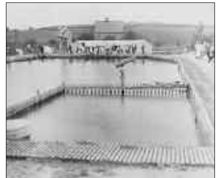
1929 Eröffnung des Bades