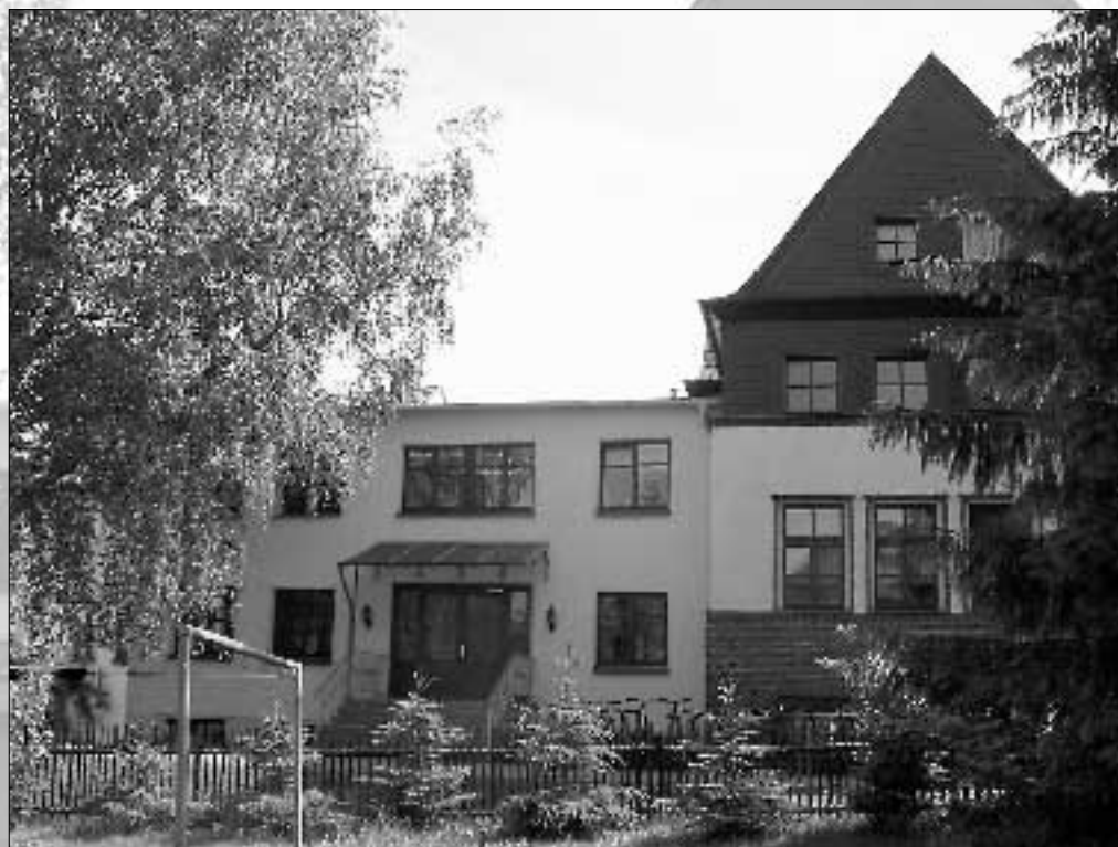
Mittelschule Auerswalde – Stammschulhaus

Wir wünschen allen unseren Grund- und Mittelschülern, den Lehrern und Eltern erlebnisreiche und erholsame Ferien.